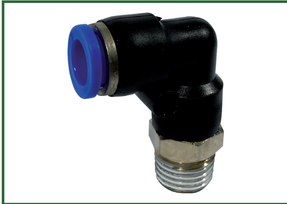
PL - Rosca gas.